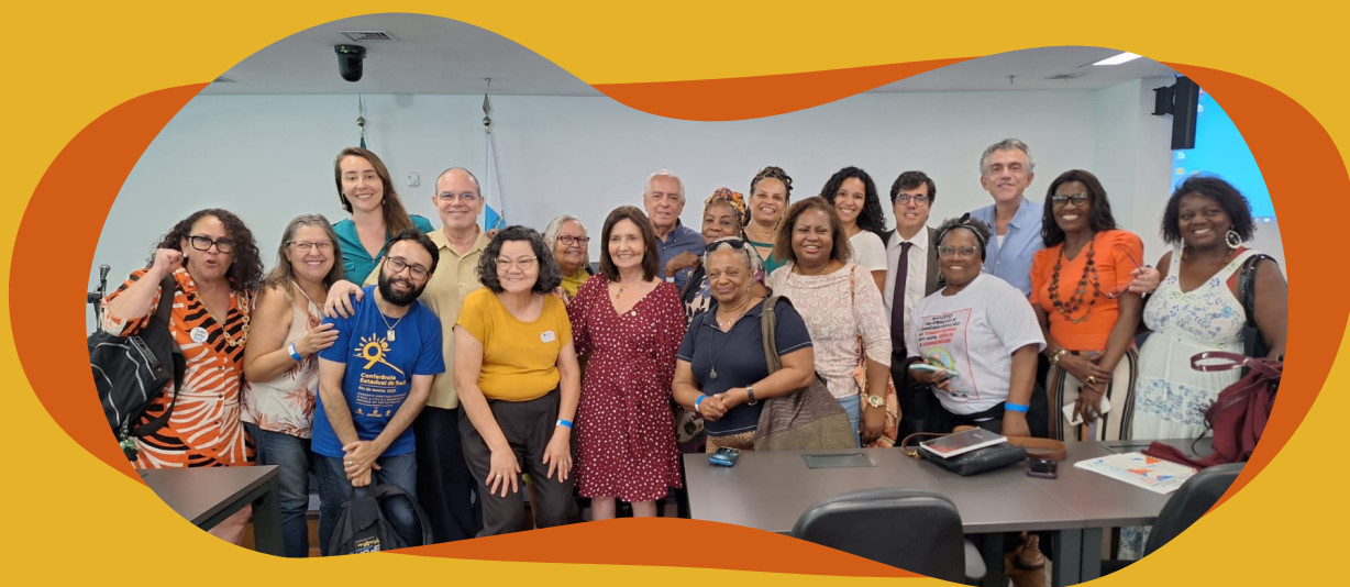
Participação em audiências públicas

Já em setembro e outubro de 2023, os ativistas do Fórum participaram de 3 audiências públicas organizadas pela Frente Parlamentar de Combate e Prevenção à Tuberculose, HIV e Diabetes, para monitorar o investimento da ALERJ de 246,5 milhões destinada ao programa de Tuberculose do Estado do Rio de Janeiro / SES-RJ. E no mês de outubro, estiveram presentes em um encontro da sociedade civil com o Ministério da Saúde e OPAS, para escuta das demandas relacionadas ao enfrentamento da tuberculose no Estado do Rio de Janeiro.