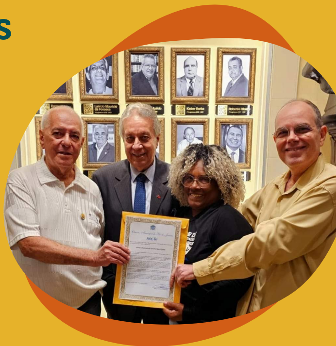
Moção na Câmara Municipal do Rio de Janeiro

Em agosto de 2023, o Fórum TB-RJ recebeu uma moção na Câmara Municipal do Rio de Janeiro, em homenagem aos seus 20 anos de atuação; no mesmo mês, seus ativistas também participaram do Dia Municipal de Conscientização, Mobilização e Combate à TB em Itaboraí, da instalação da Frente Parlamentar de Combate e Prevenção à Tuberculose, HIV e Diabetes na ALERJ, e da Reunião da Rede Brasileira de Comitês.